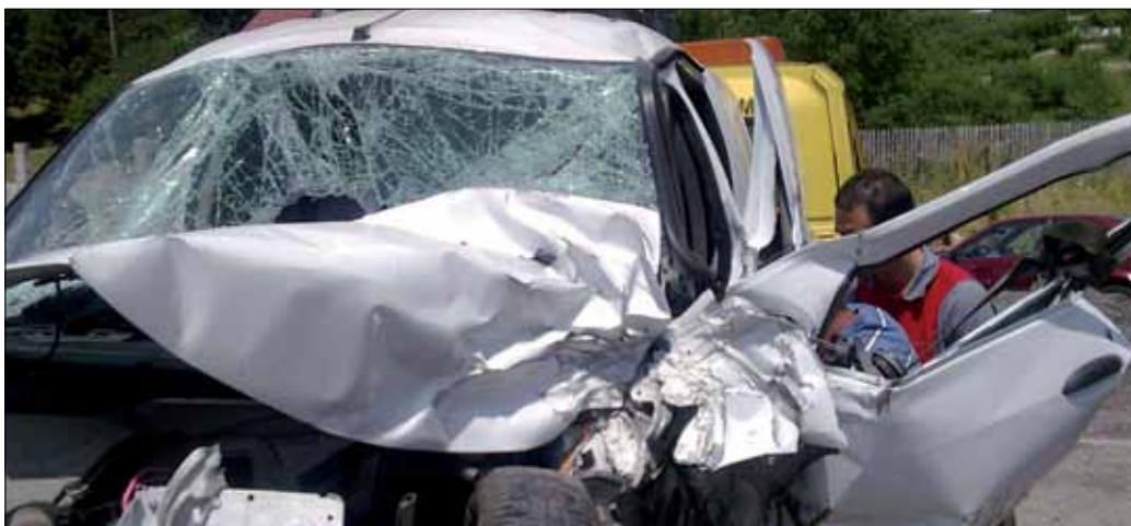
Das Unfallauto war nur noch ein Wrack: Der Aufprall erfolgte mit enormer Wucht.