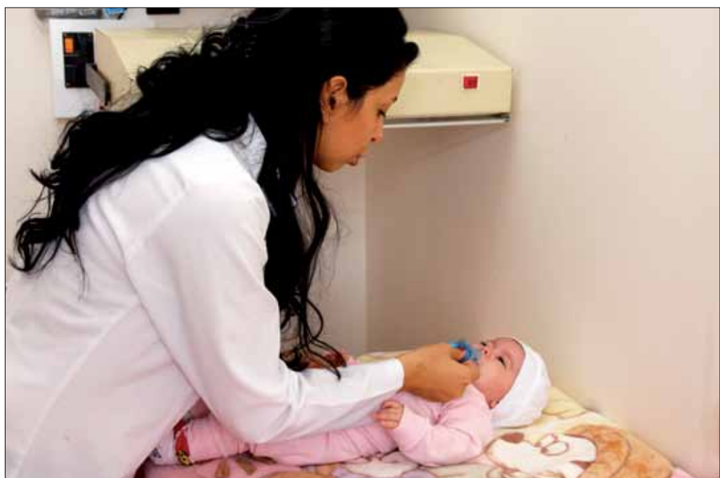
Infusionen, Spritzen, Bluttests: Auch sehr junge Kinder werden in der Klinik behandelt.