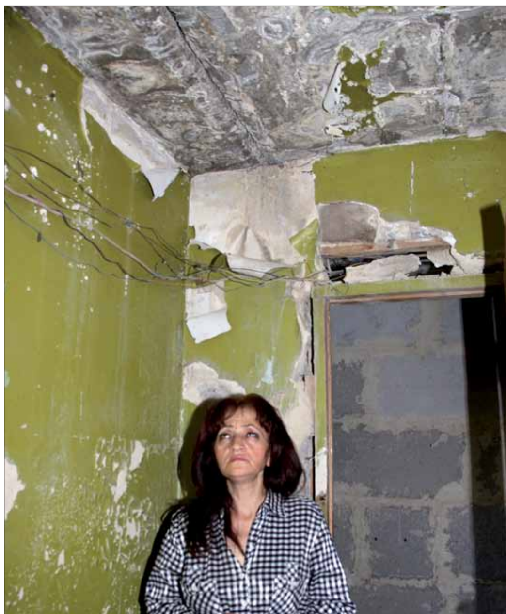
Narine: Unverschuldet seit Jahren in Not.