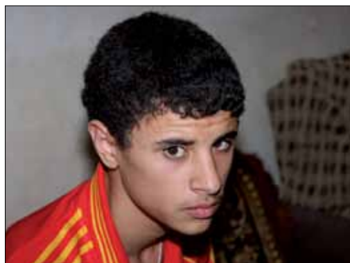
Wasgen: krank und ohne Ausbildung chancenlos.